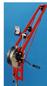
KC svängbar handwinch m räk- neverk o broms

Vill Ni beställa, eller veta mera om våra produkter, kontakta oss: SWEDAQ Klintebo Gård 243 95 HÖÖR, tel 0413-33400 fax 0413-334 05 E-mail: j.b@swedaq.se web: www.swedaq.se