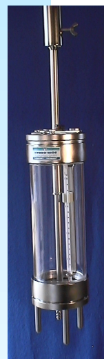
Hydro-Bios, 1 liter

Finns i 0,5, 1 alt 2 liters volym i standardutförande samt i 1 liters metallfritt utf. Såsom alla H-B hämtare har även dessa öppningsbart lod som standard, för enklare hantering, speciellt vid längre linor.