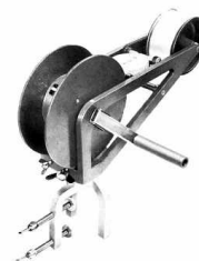
Hydro-Bios, svängbar handwinch m räkne- verk o klämfäste