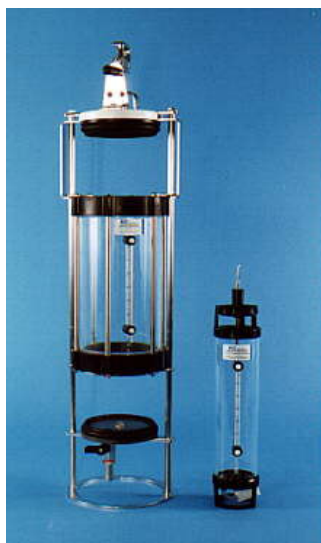
KC 1,7 resp 0,7 liters Ruttner

Ordinärt fall-lod som std, öppningsbart som tillval.